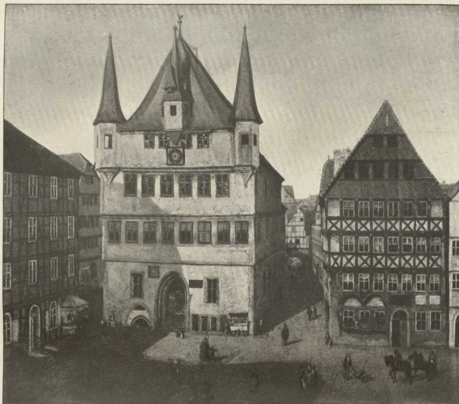
Das alte Rathaus am Markt (1837 abgebrochen)