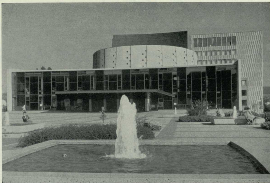
Staatstheater Kassel - Großes Haus