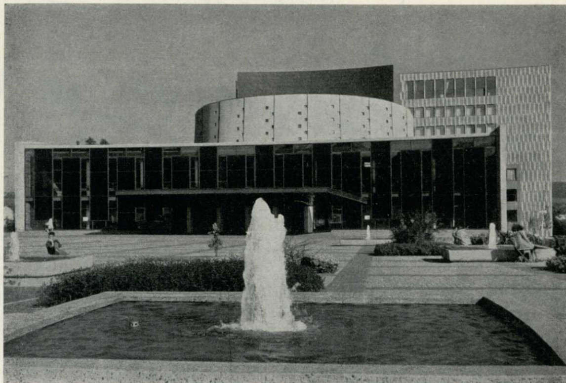
Das Große Haus - Haupteingang