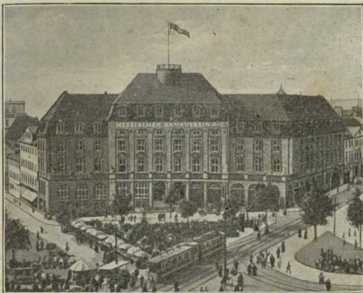
Bankgebäude am Königsplatz in Cassel.