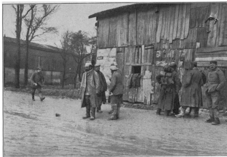
Unsere Feldgrauen in Ripont vor ihrem Quartier.