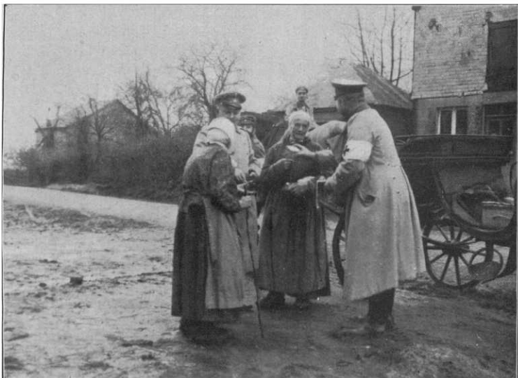
Beim Eierhandel mit den Einwohnern (Les Alleux).