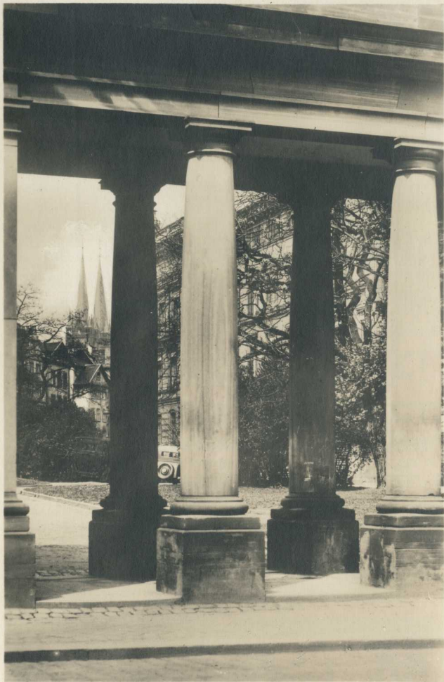
Kassel. Durchblick vom Äueto auf Regierungsgebäude und St. Martinstürme