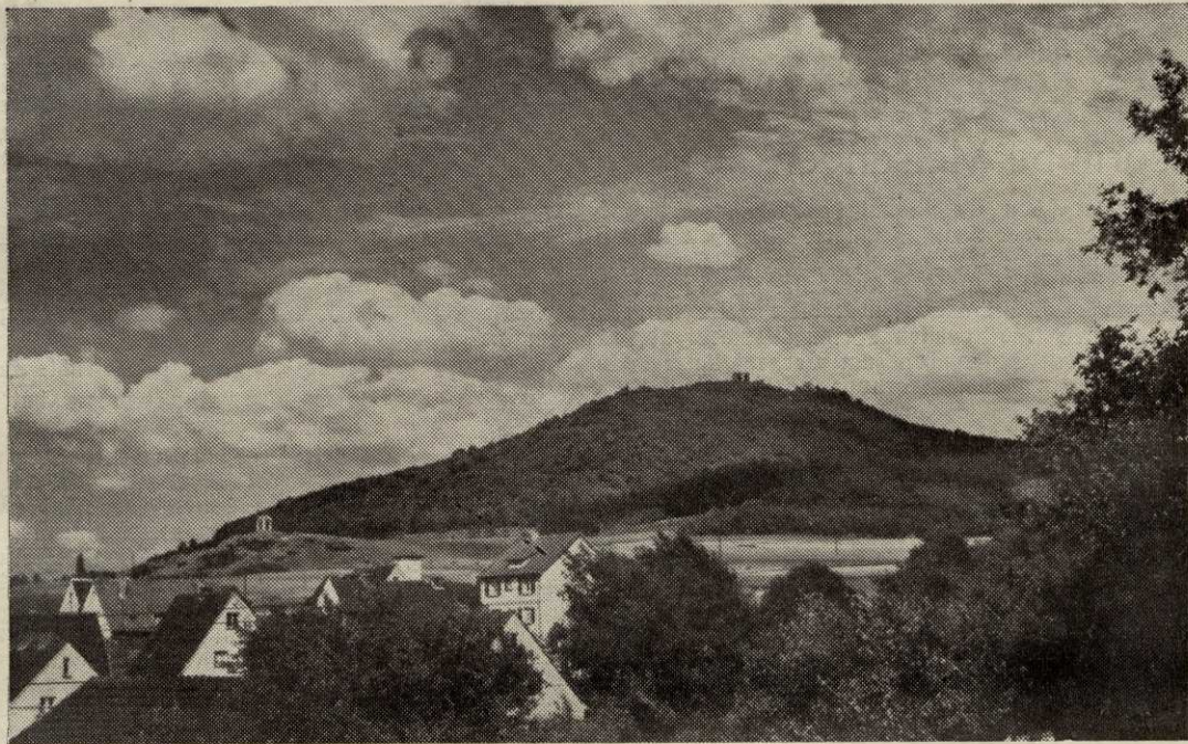
BLICK ZUM HEILIGENBERG MIT GAUEHRENMAL