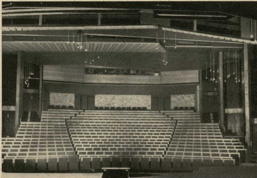
Zuschauerraum des Kleinen Hauses

Bei einigen Vorstellungen werden drei weitere Reihen als „Orchestersitze“ (44 Plätze) vorgebaut