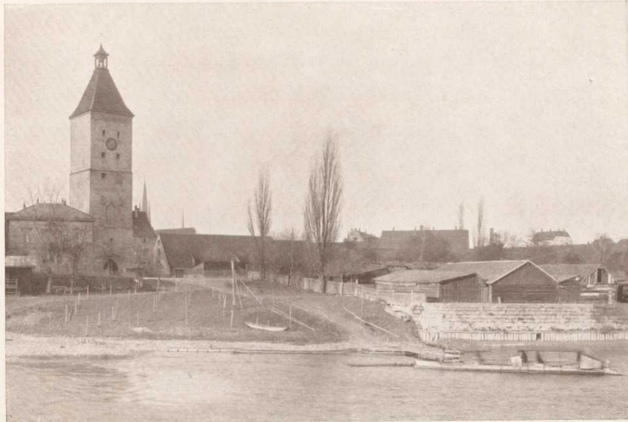
Holzlagerplatz am Gänstor 1877-1887

Einrahmern und drang auf seinen langjährigen Reisen durch Deutschland, Schweiz und Österreich überall erfolgreich durch. Seine Frau besorgte in diesen Reisejahren zu Hause die innere Verwaltung mit allen schriftlichen Arbeiten in vorbildlicher Weise. Sie war ihm