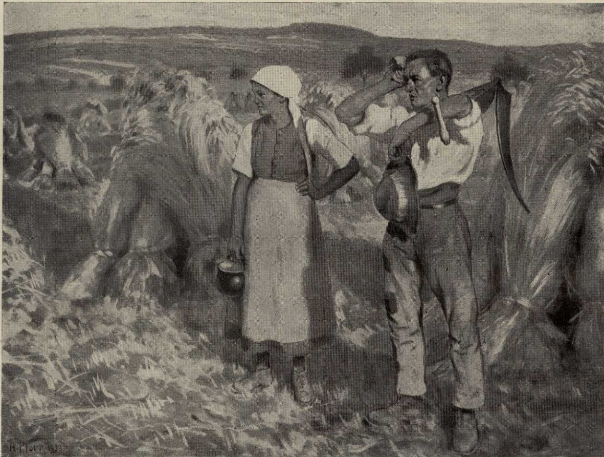
Fleißige Hände bergen in der Heimat die Ernte