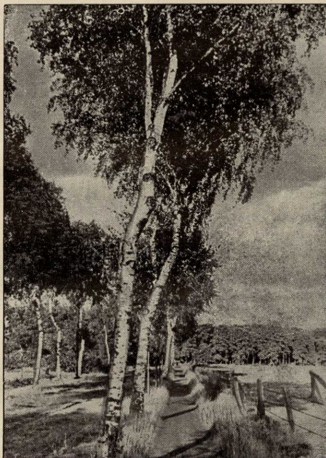
Die Birken der Heimat haben wieder ihren Pfingstschmuck angelegt