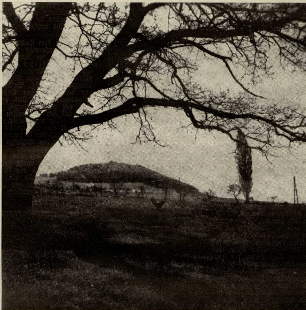
BLICK VON DER DOMÄNE MITTELHOF ZUM HEILIGENBERG