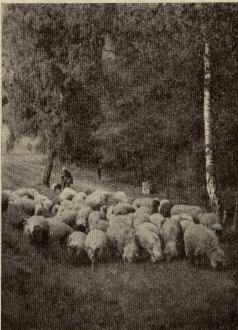
IM KIRCHHOFER GRUND