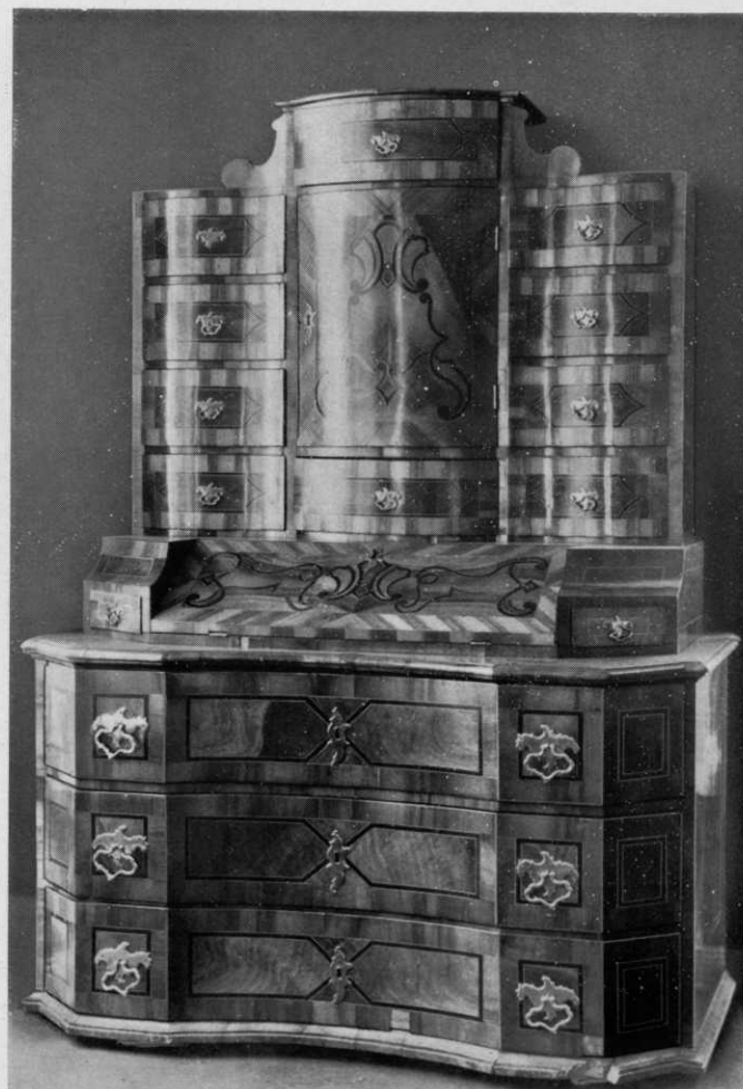
3. garnierter Schreibschrank