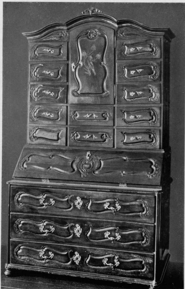
1. Schreibschrank aus Nussholz